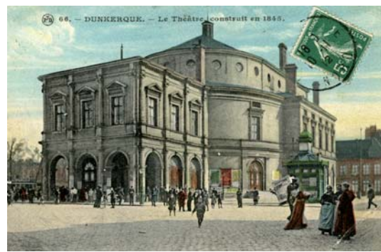
Le théâtre à l'italienne construit en 1845

Florent Poivre memoiredutheatre@lebateaufeu.com ou 03 28 51 40 30