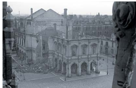
Destruction pendant la Seconde Guerre mondiale