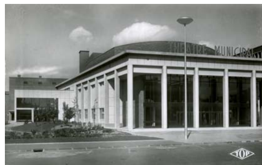
Le théâtre reconstruit en 1963